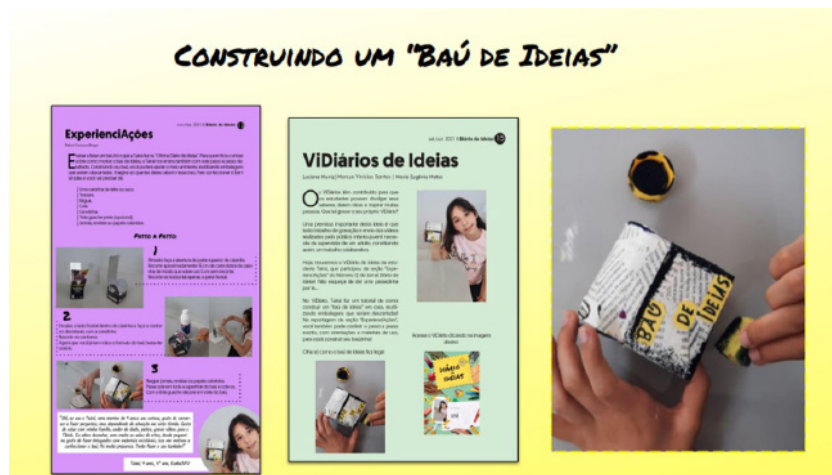
Imagem do baú de tesouro construído pelas crianças com materiais recicláveis

4º momento: caça ao tesouro das ideias na Floresta Encantada.