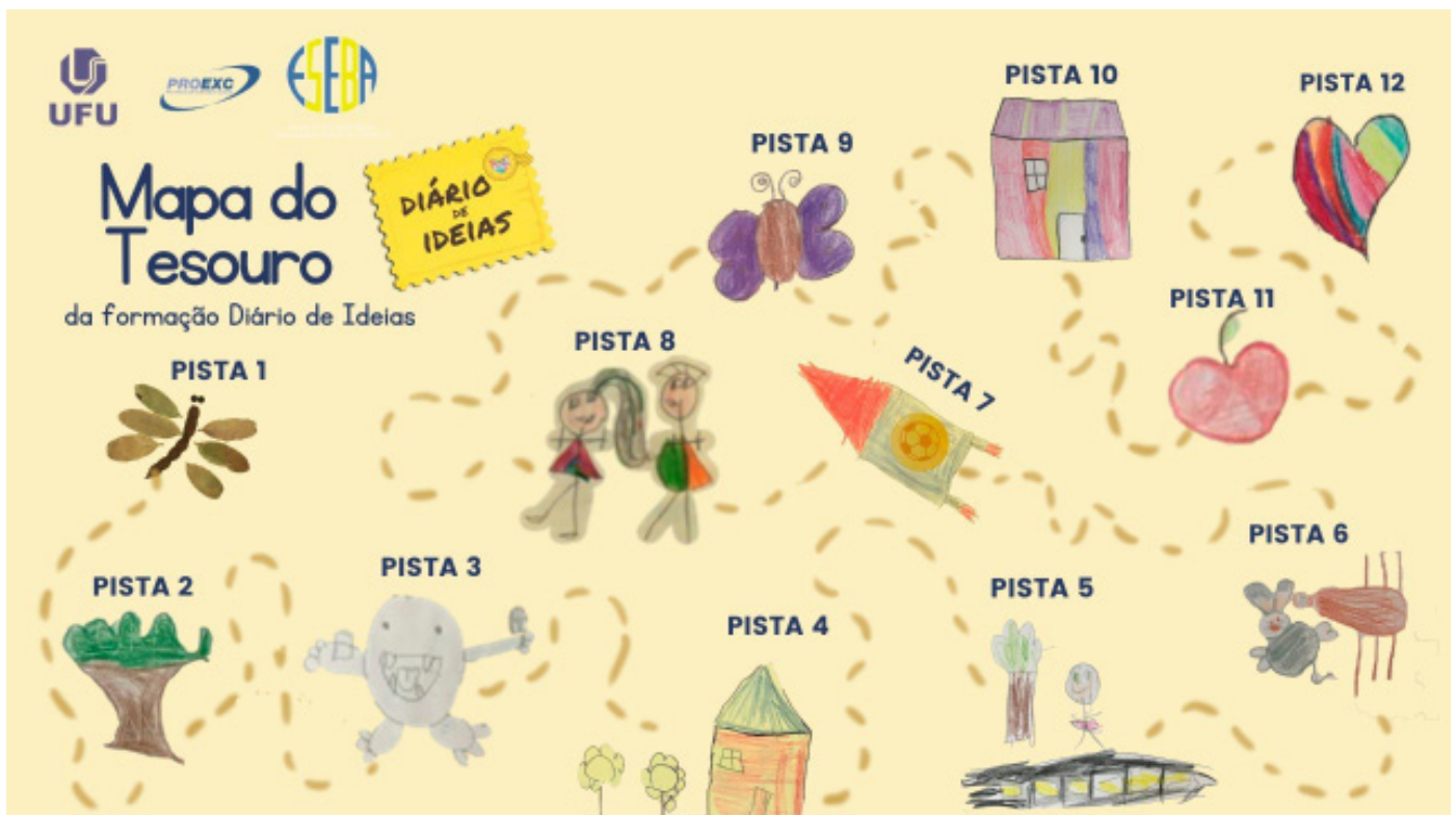
“Mapa do Tesouro” da Formação de Professores “Diário de Ideias”