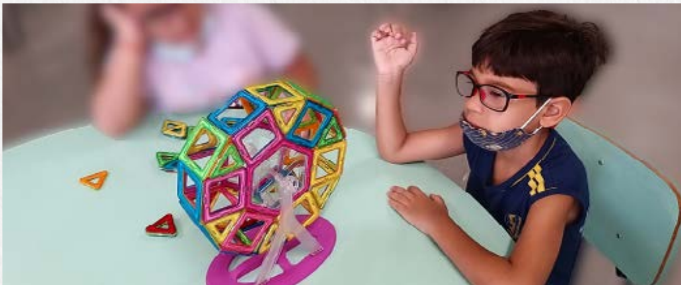
Brincando de construir uma roda-gigante com blocos magnéticos!