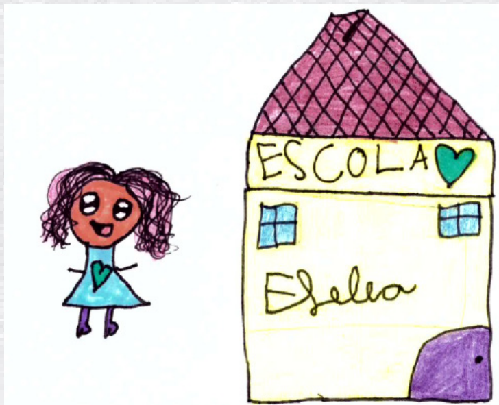
Desenho da Cristal sobre o retorno às aulas presenciais