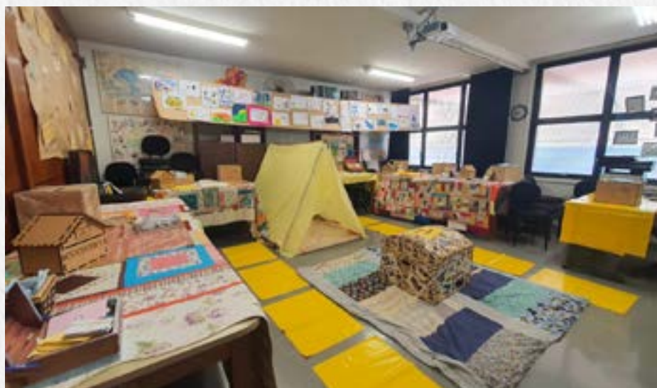
Imagem ampla da exposição "Explosão de Ideias em Ação"

As turmas fizeram um passeio pela sala e foram apresentados cada elemento que compunha a exposição.